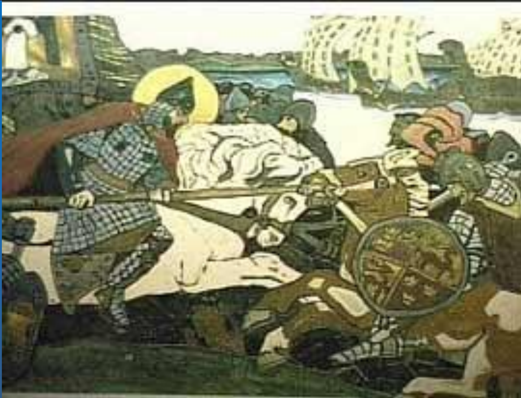
"Бой Александра Невского с Биргером" (картина Н. К. Рериха)