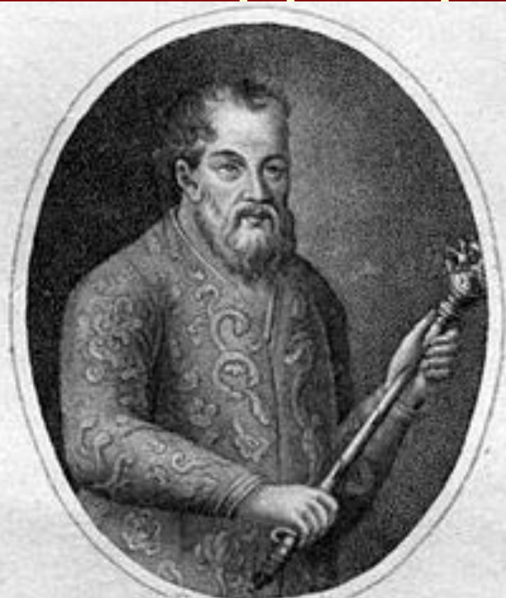
Князь, Дмитрий Михайлович Пожарский, Бояринь.