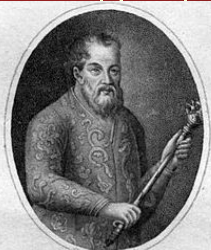
Князь, Дмитрий Михайлович Пожарский, Бояринъ.