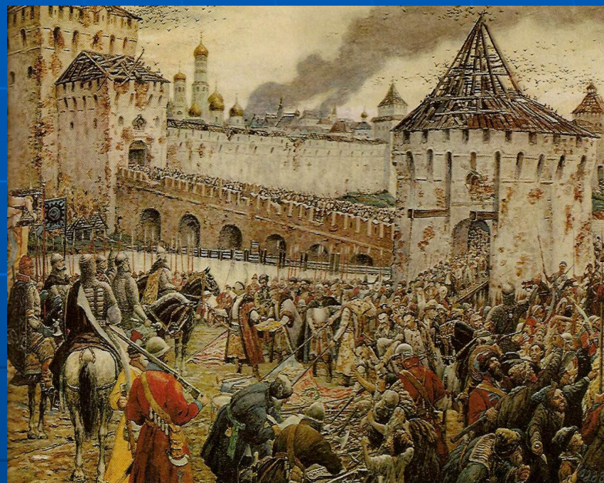
Изгнание польских интервентов из Московского Кремля