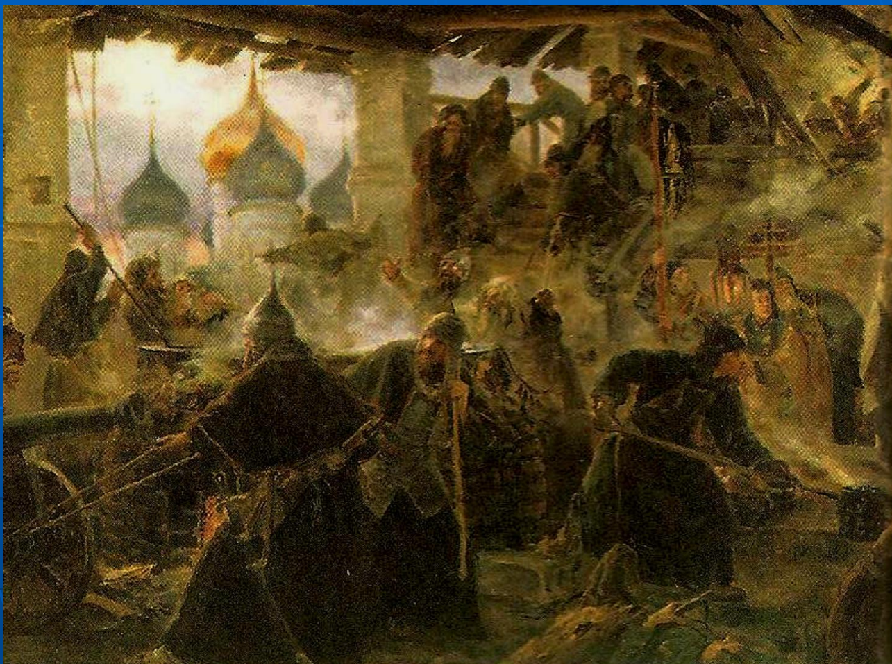
Осада Москвы первым земским ополчением