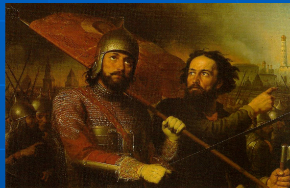
Минин и Пожарский