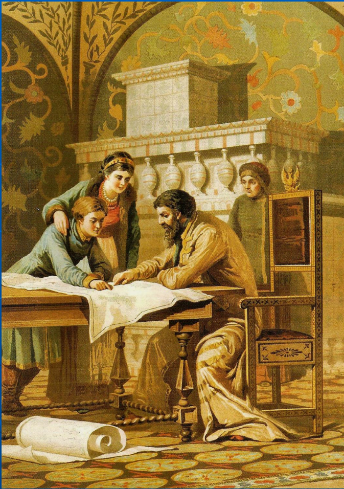
Царь Борис Годунов с детьми