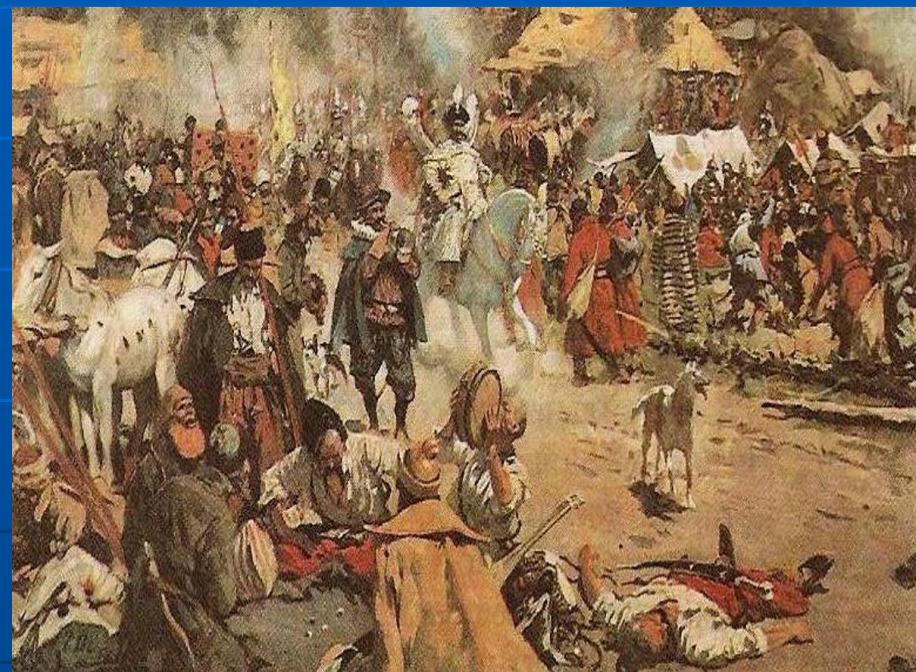
Лагерь Лжедмитрия II в селе Тушине под Москвой