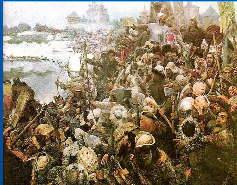
Столкновение феодалов и зависимых людей