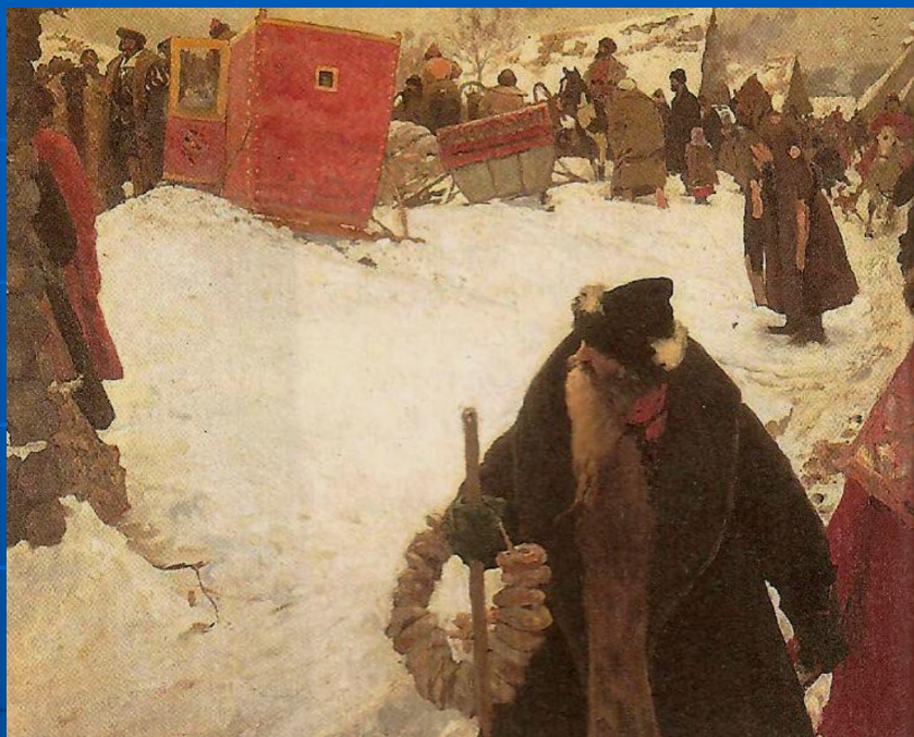
Приезд поляков в Москву