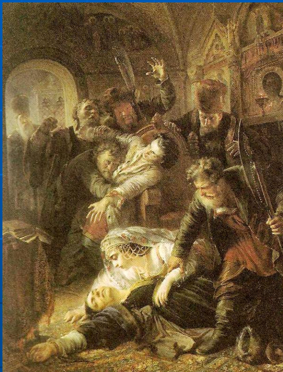
Смерть царя Федора