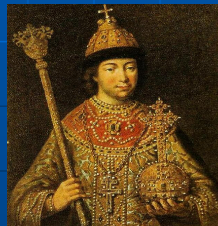
Царь и великий князь Михаил Фёдорович Романов