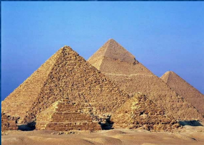
Гиза. Долина Пирамид