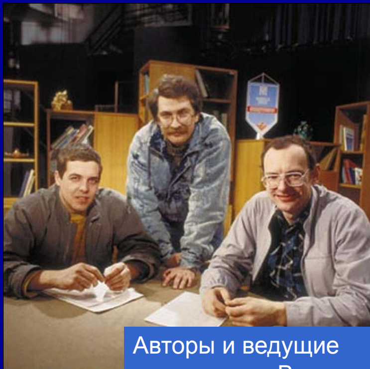
Авторы и ведущие программы «Взгляд»