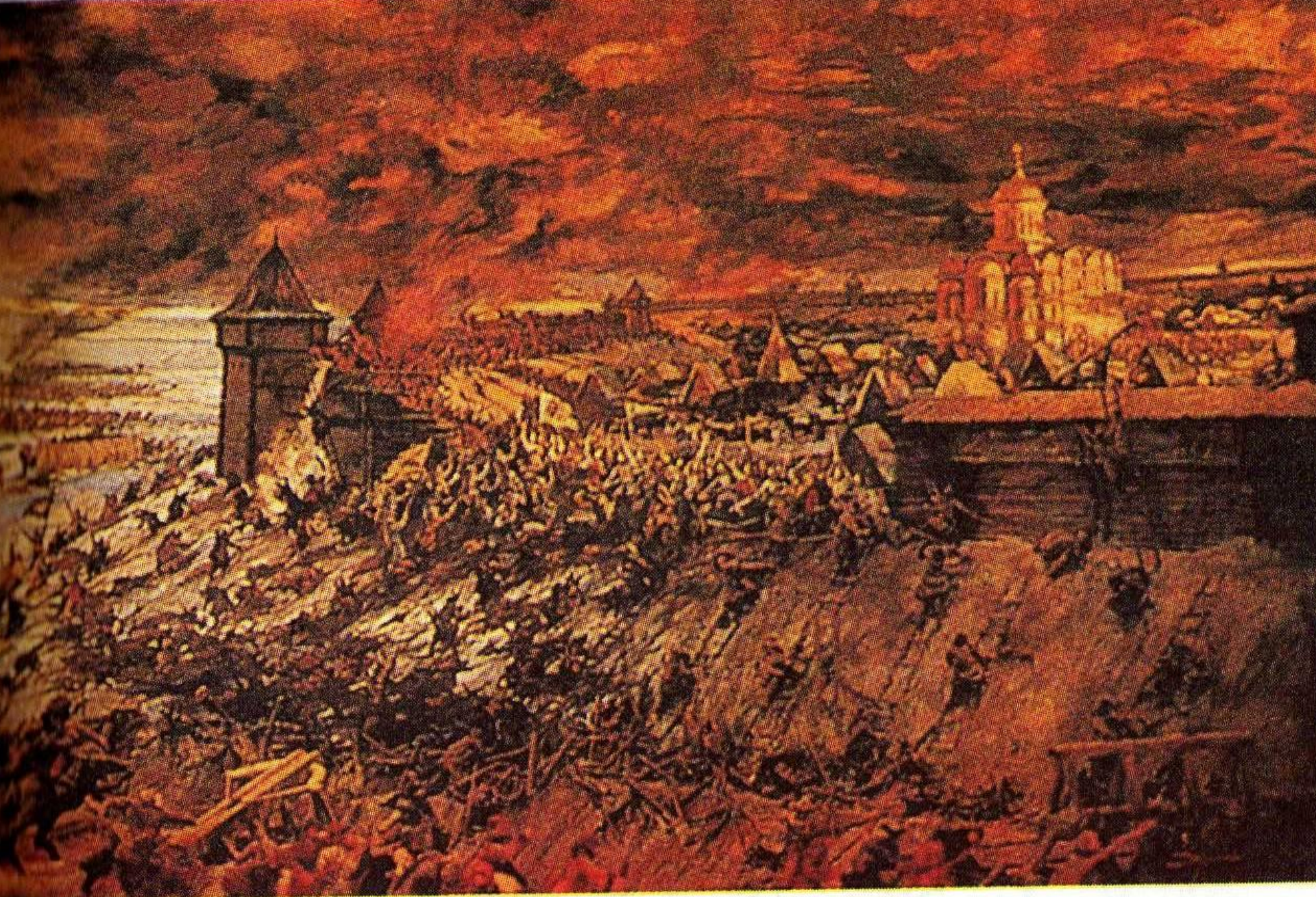
Штурм монголо-татарами Рязани.