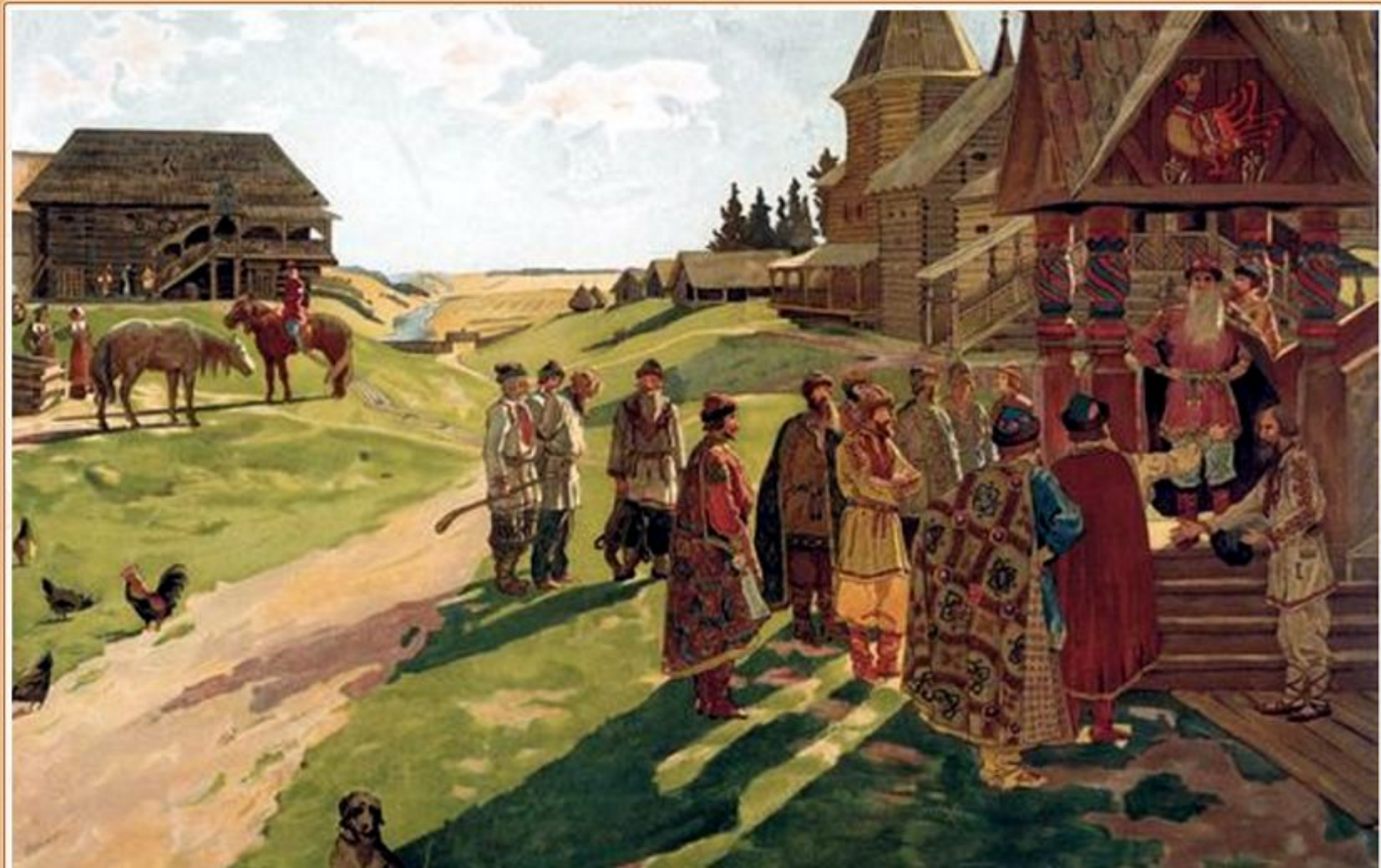
В усадьбе князя