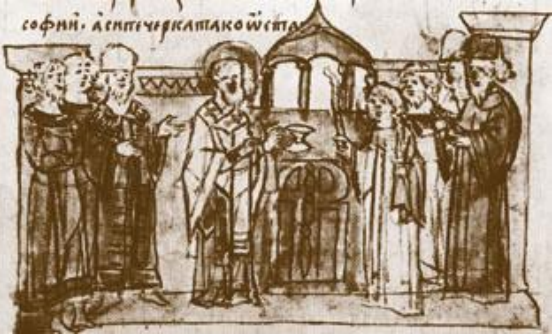
Первый митрополит - Иларион