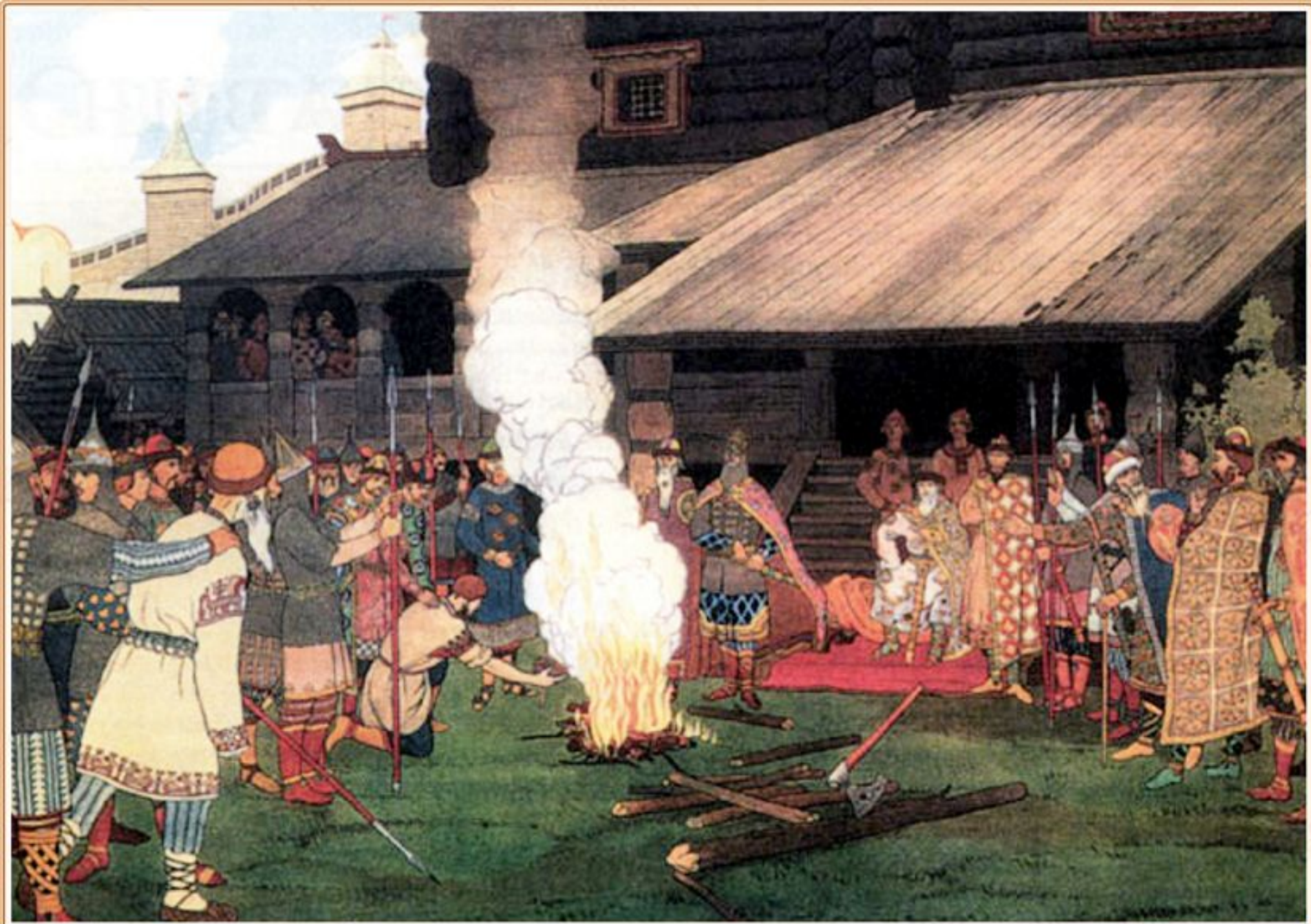
Суд на Руси во времена Русской Правды. Художник И. Я. Билибин