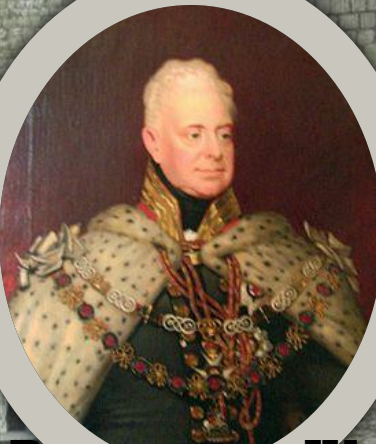
Вильгельм IV William Henry