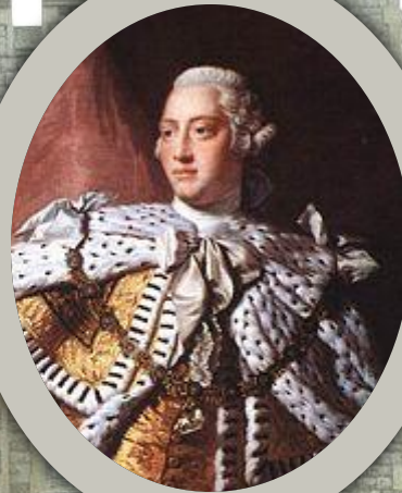
Георг III George William Frederick