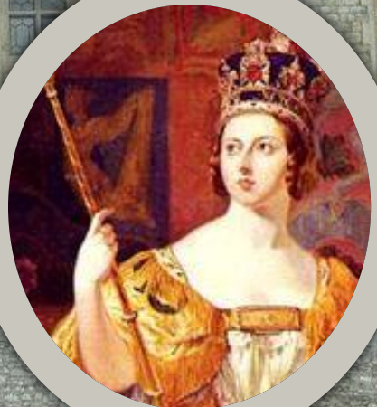
Виктория Alexandrina Victoria