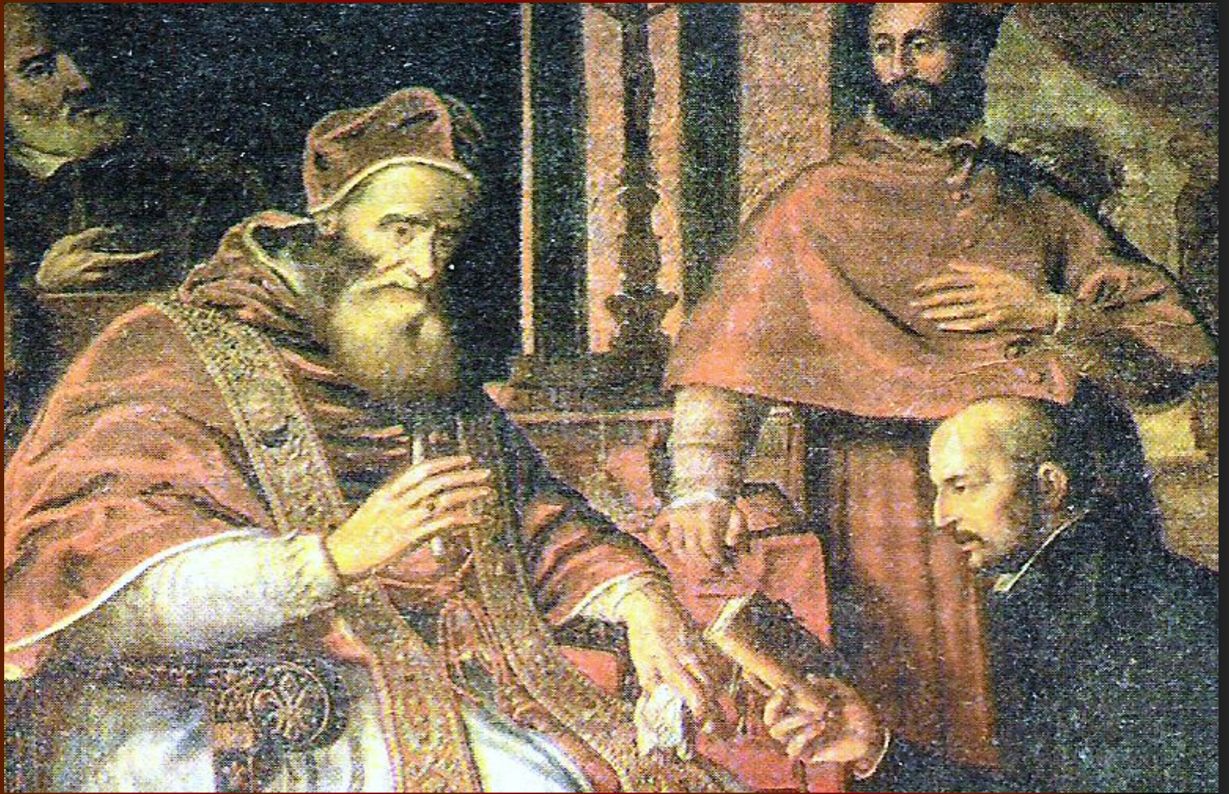
Игнатий Лойола вручает папе Павлу III устав ордена иезуитов.