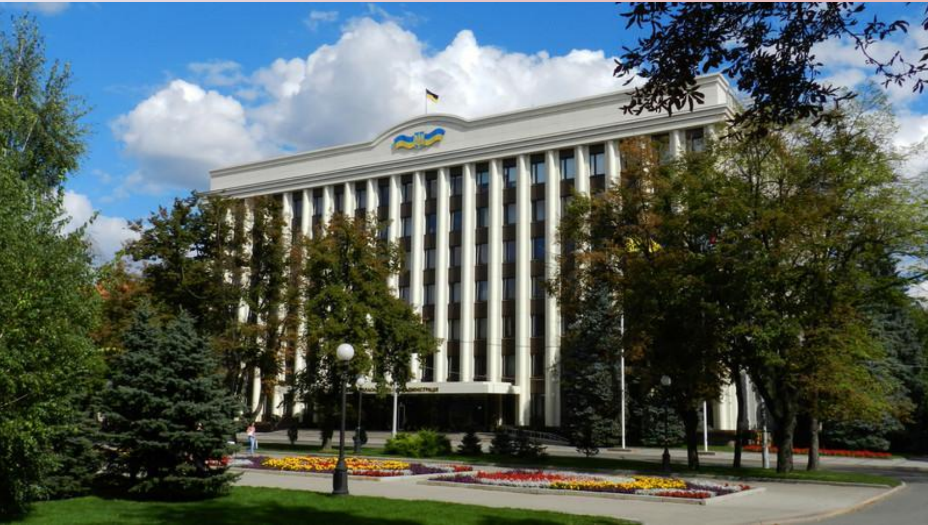
Здание областной Администрации