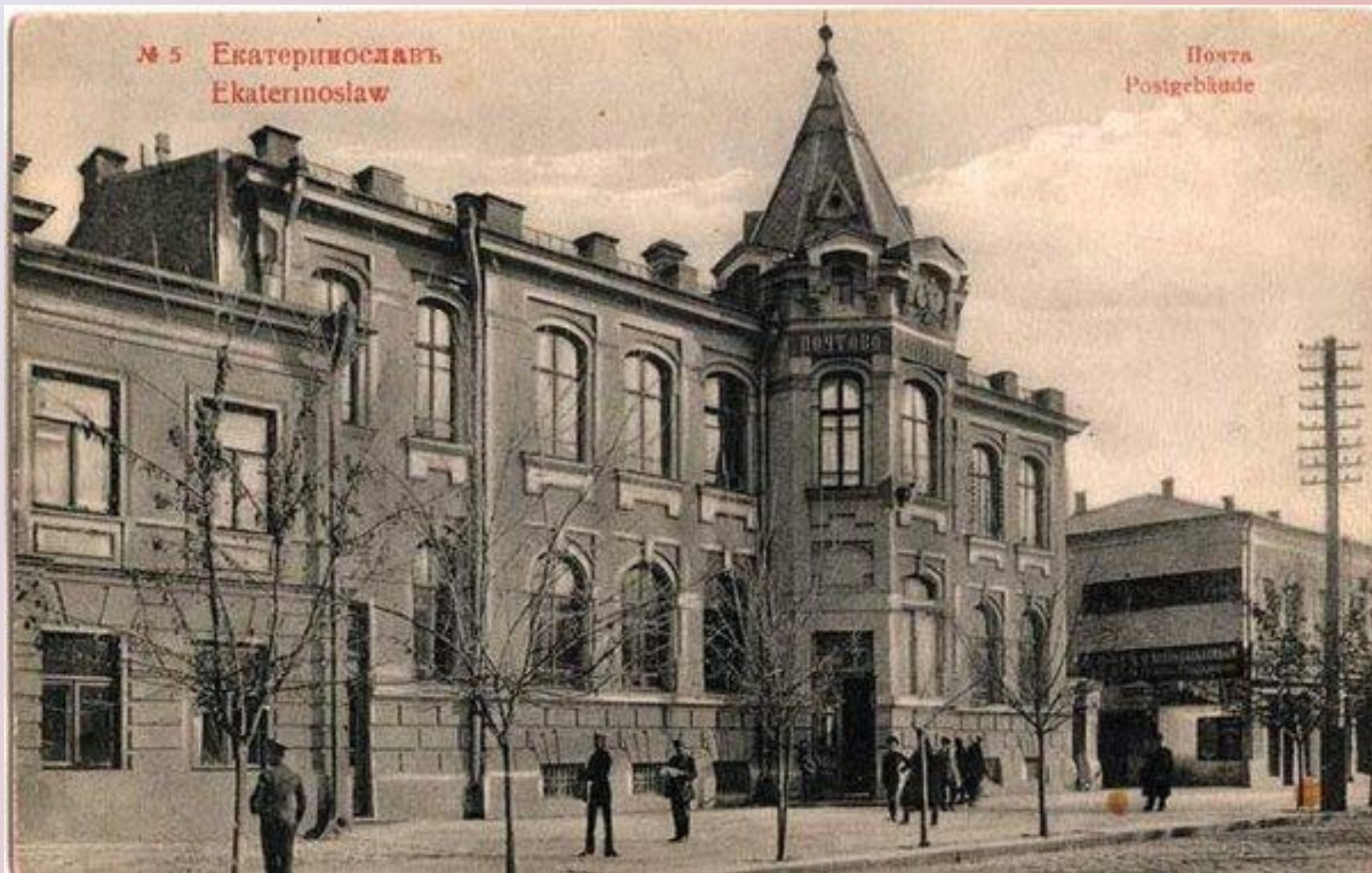
Главпочтамт (до 1917 года)