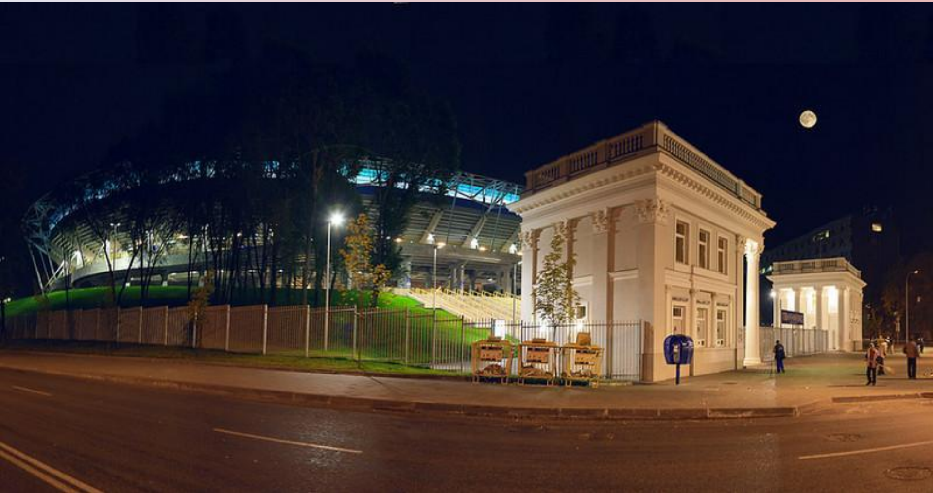
Стадион Днепр - Арена