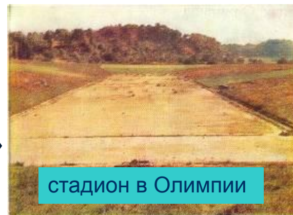
стадион в Олимпии