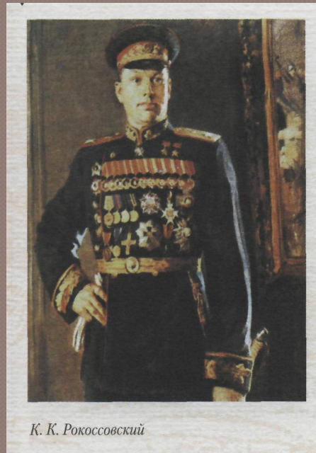
К. К. Рокоссовский