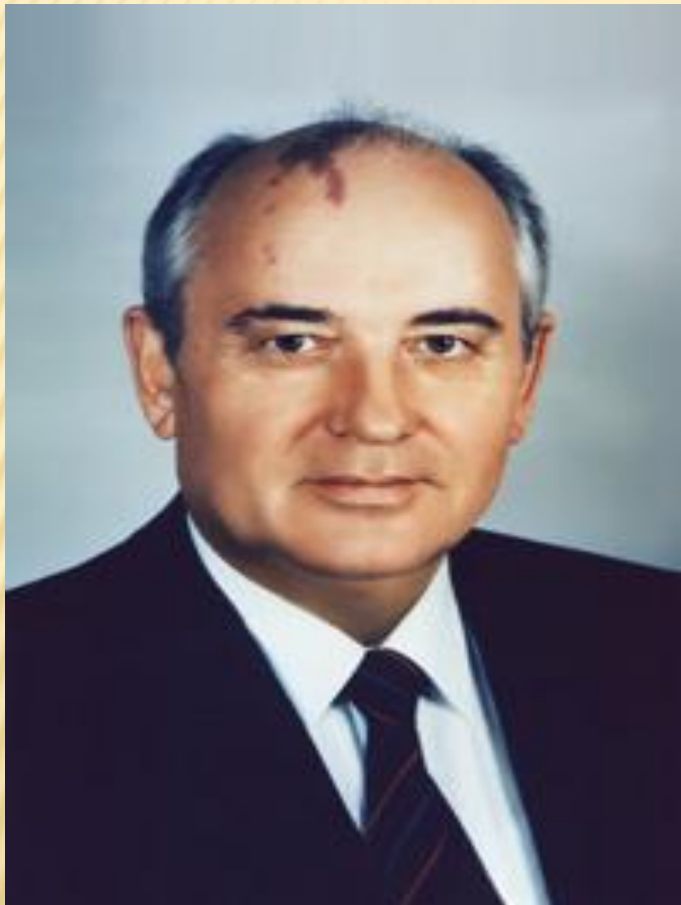
М.С.Горбачев р. в 1931г. Генеральный секретарь ЦК КПСС (с 1985-1991), Председатель Верховного совета СССР (1989), Президент СССР (1990-1991)