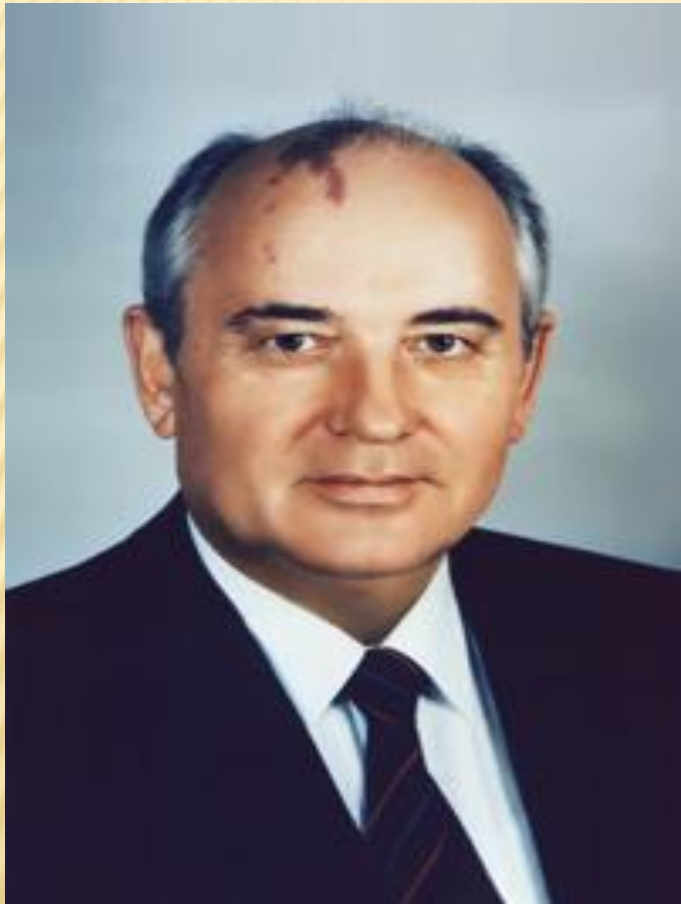
М.С.Горбачев р. в 1931г. Генеральный секретарь ЦК КПСС (с 1985-1991), Председатель Верховного совета СССР (1989), Президент СССР (1990-1991)