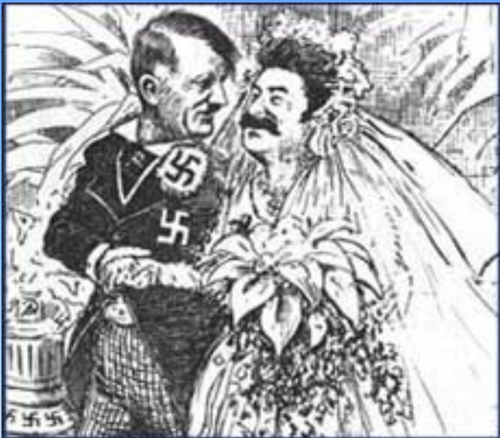
карикатура американца Клиффорда Берримана

1. Какие события отражены в данной карикатуре?