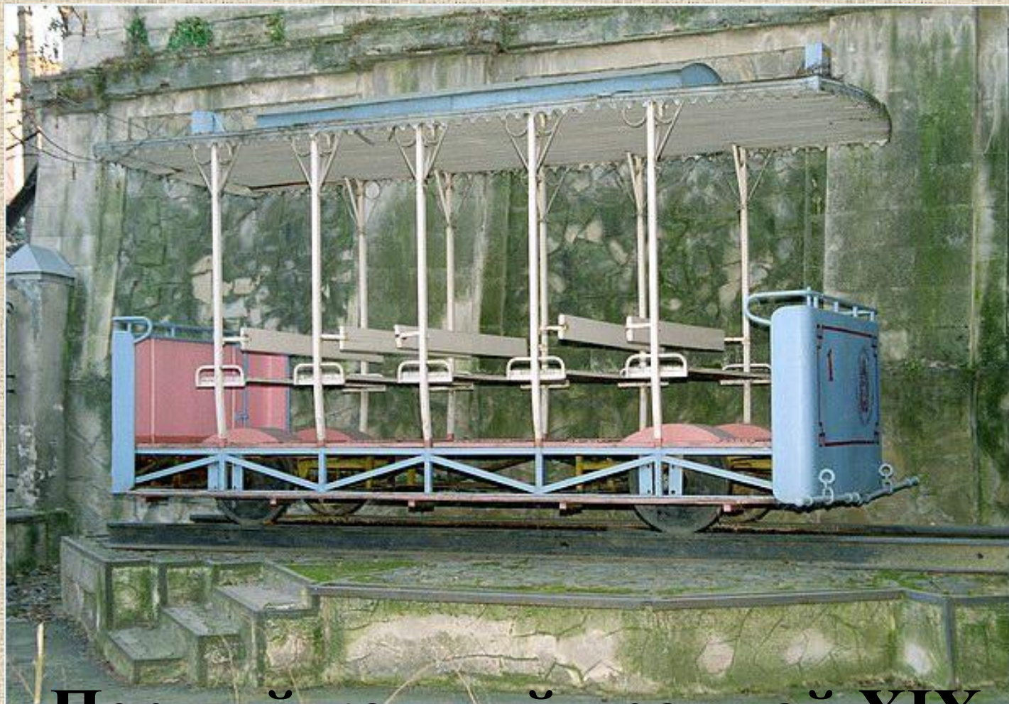
Первый конный трамвай XIX века Паровоз 1950 года