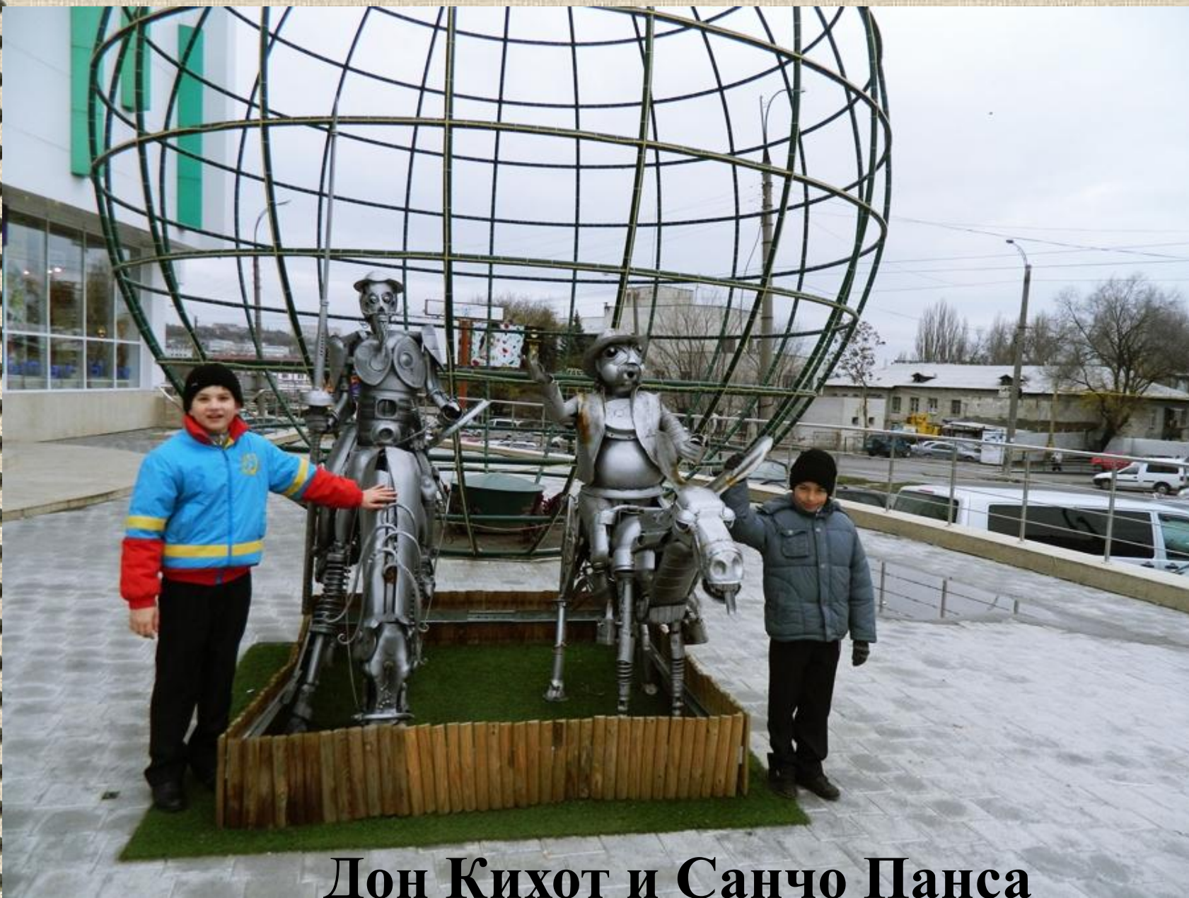
Дон Кихот и Санчо Панса