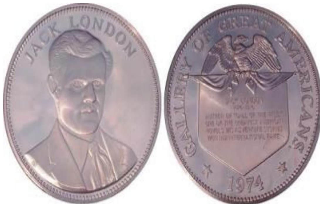
памятная медаль в честь Джека ЛОНДОНА