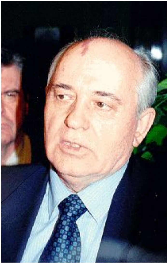
М.С. Горбачев после отставки. 25 декабря 1991 г.