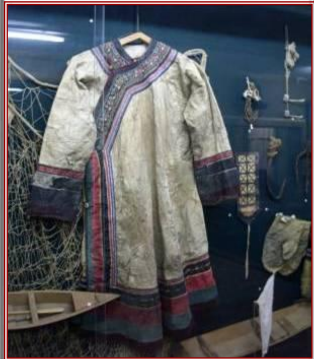
Одежда нанайцев из рыбьей шкуры