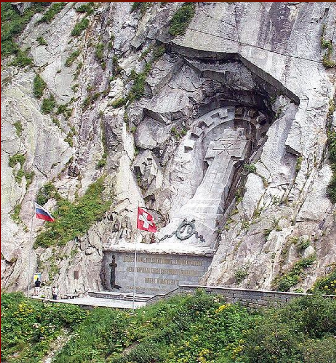
Памятник Суворову в швейцарских Альпах