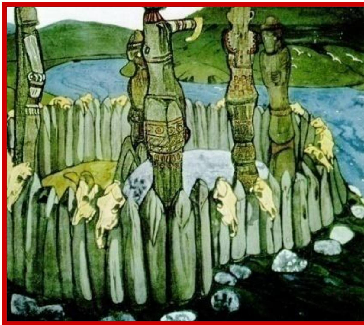
Н. Рерих. Языческое святилище