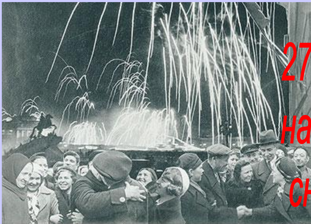
«БЕЛКАЯ ПОВЕДА ОДЕРЖАНА СОВЕТСКИМИ ВОЙСКАМИ ПОД ЛЕНИНГРАДОМ:

27 ноября 1944 года наши защитники сняли блокаду