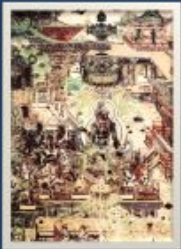
настенная роспись из монастыря Дуньхуан с изображением буддийского рая