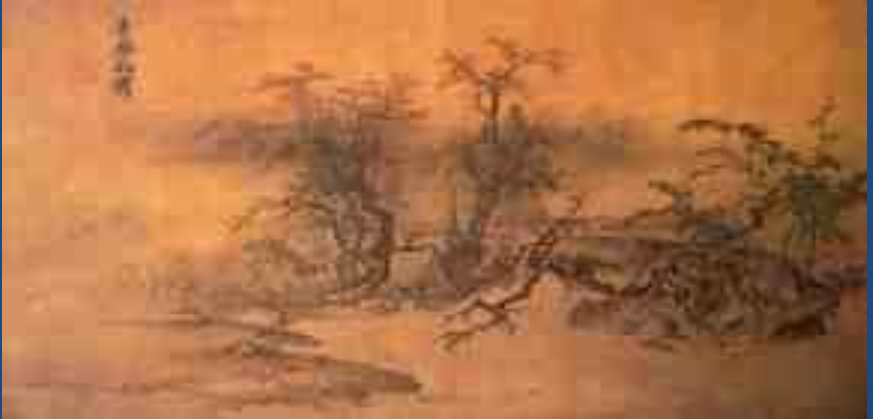
китайская живопись Ма Линь. Благоухание весны- ясное небо после дождя.