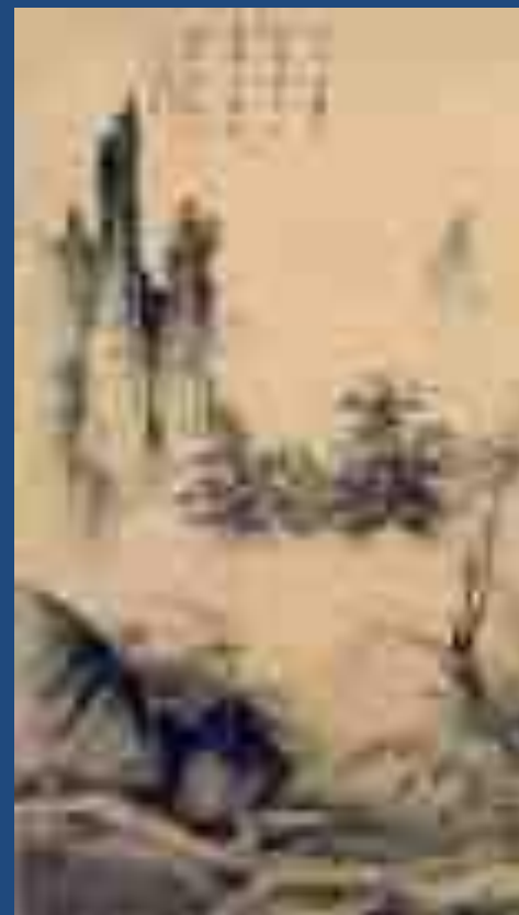
китайская живопись Ма Юань. Напевая в пути.