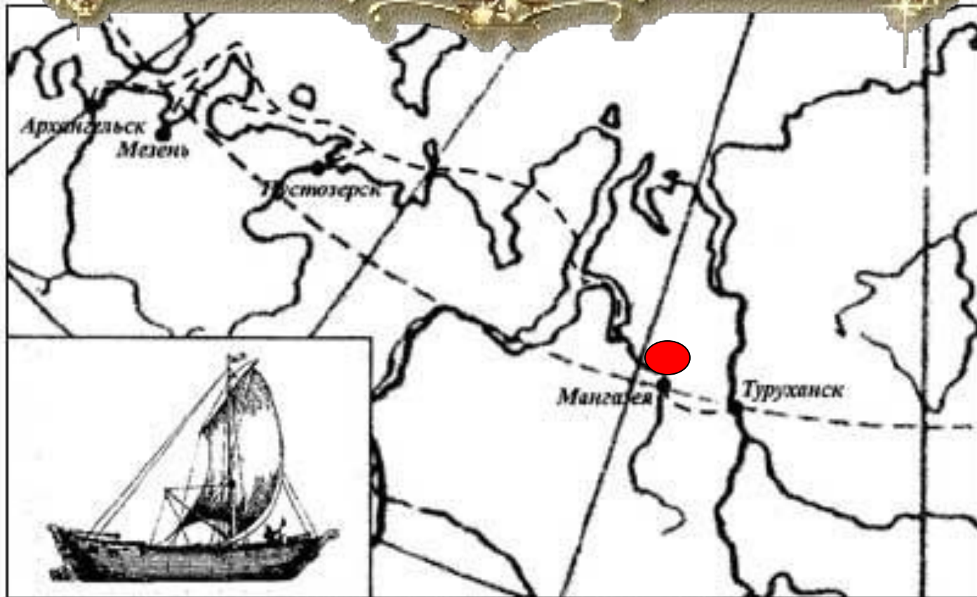
Мангазейский морской путь с частичными проходами по рекам и волокам (на малых кочах)