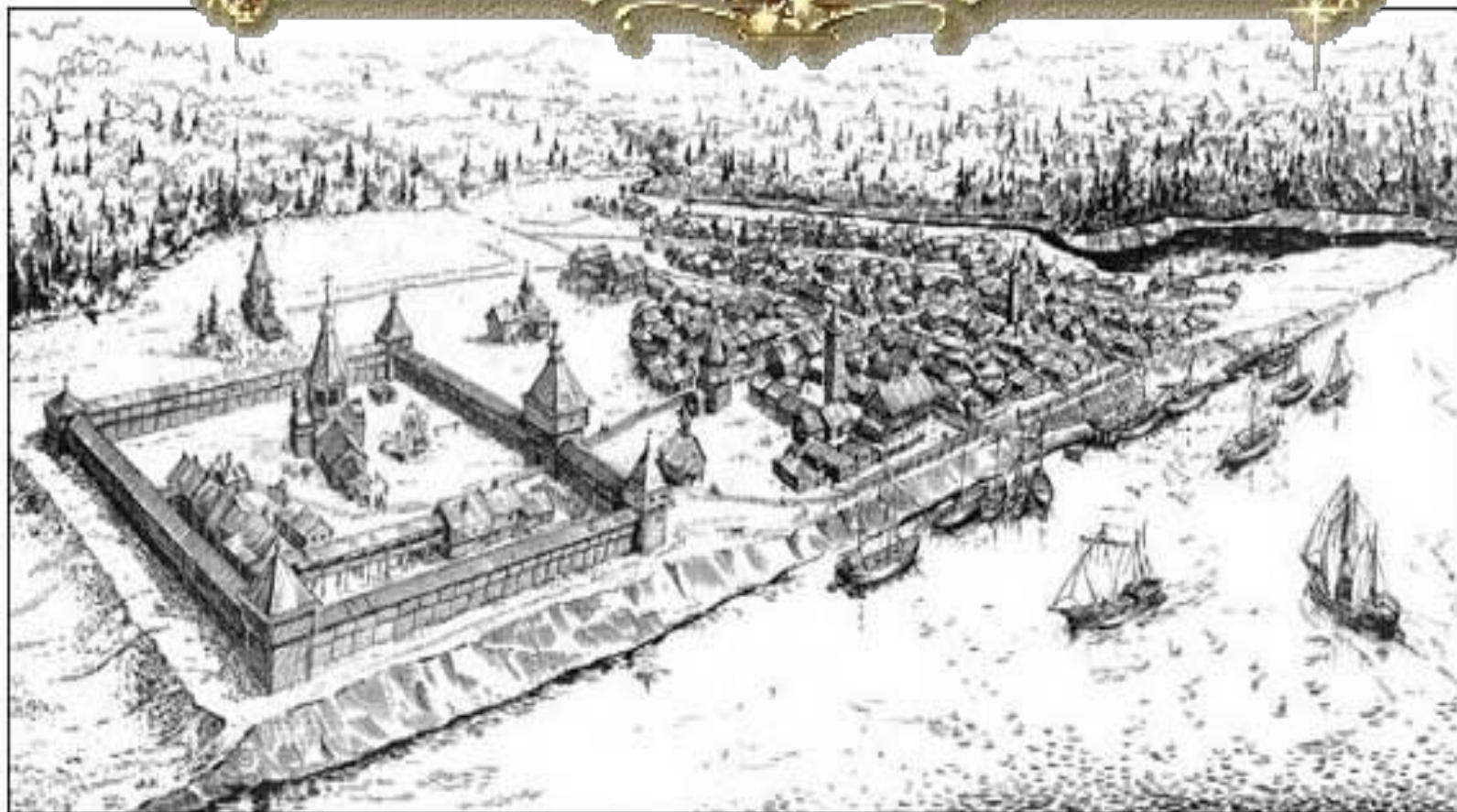
Град Мангазея. Реконструкция.