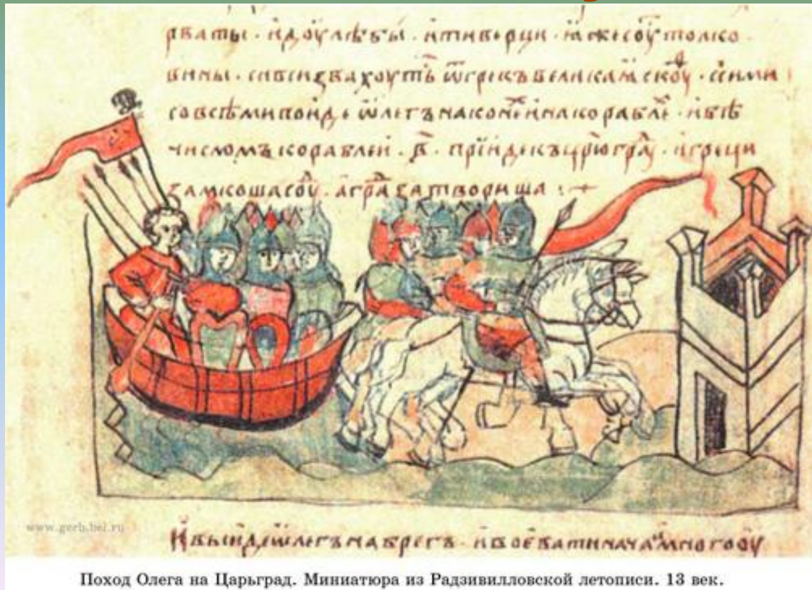
Поход Олега на Царьград. Миниатюра из Радзивилловской летописи. 13 век.