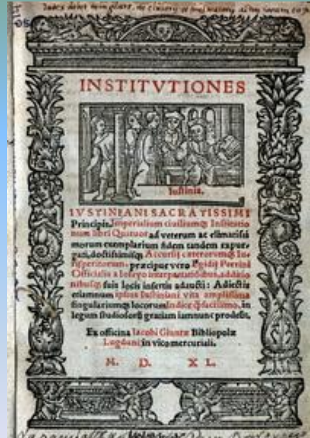
СВОД ЗАКОНОВ ЮСТИНИАНА

Создан свод Юстиниана, где были собраны и упорядочены все законы; Расширена территория империи, присоединены земли С. Африки, часть Испании, Италию; Строились храмы и