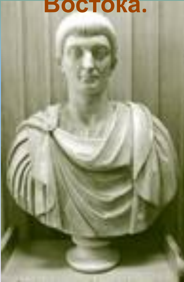
Император Константин I

• Император Константин, принявший в 313 г. христианство, в 330 провозгласил Константинополь (Византий) новой столицей Римской империи; Император Феодосий в 395 г. разделил Римскую империю на Западную и Восточную.