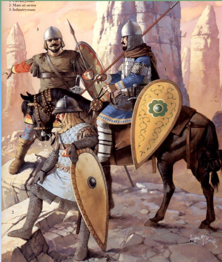
1- кавалерист; 2 - оруженосец; 3 - пехотинец.