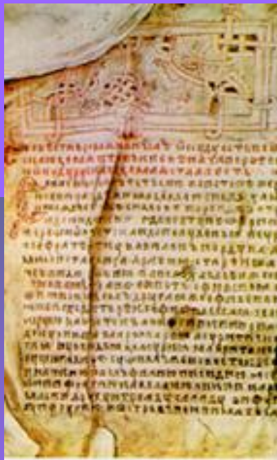
Повесть временных лет