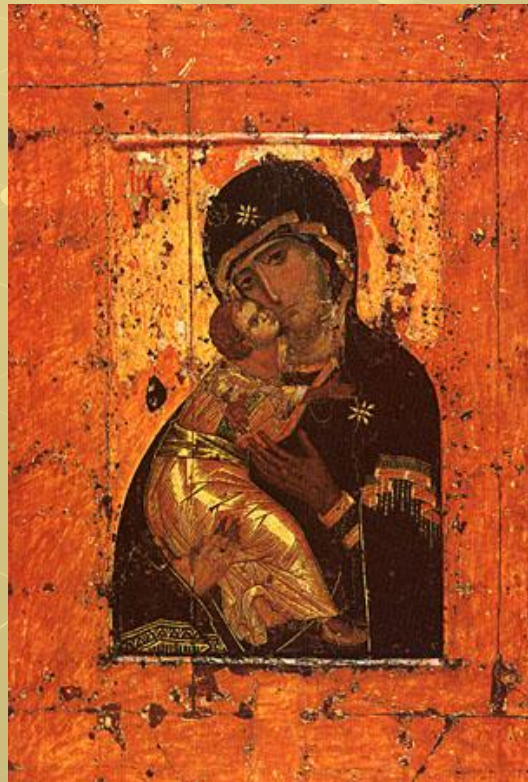
Владимирская икона Божией Матери