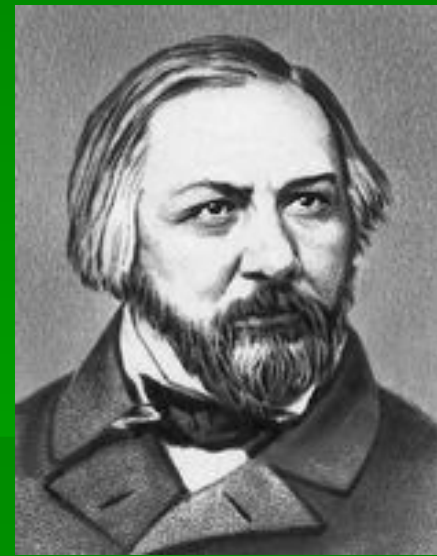
Михаил Иванович Глинка