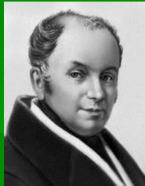
Василий Андреевич Жуковский