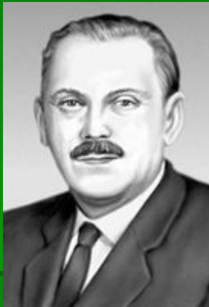
Сергей Владимирович Михалков

Назовите автора слов гимна Российской Федерации, утвержденного в 2001 году?