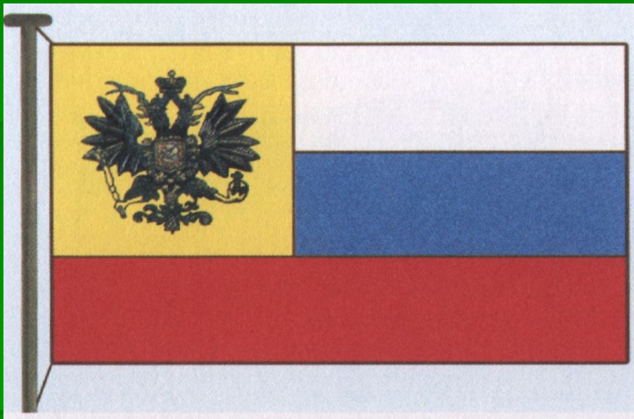
Флаг 1914 года