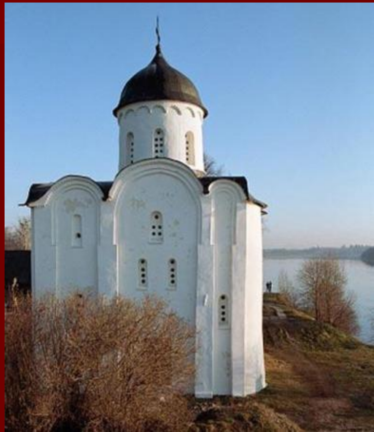
Храм 12 века, Старая Ладога