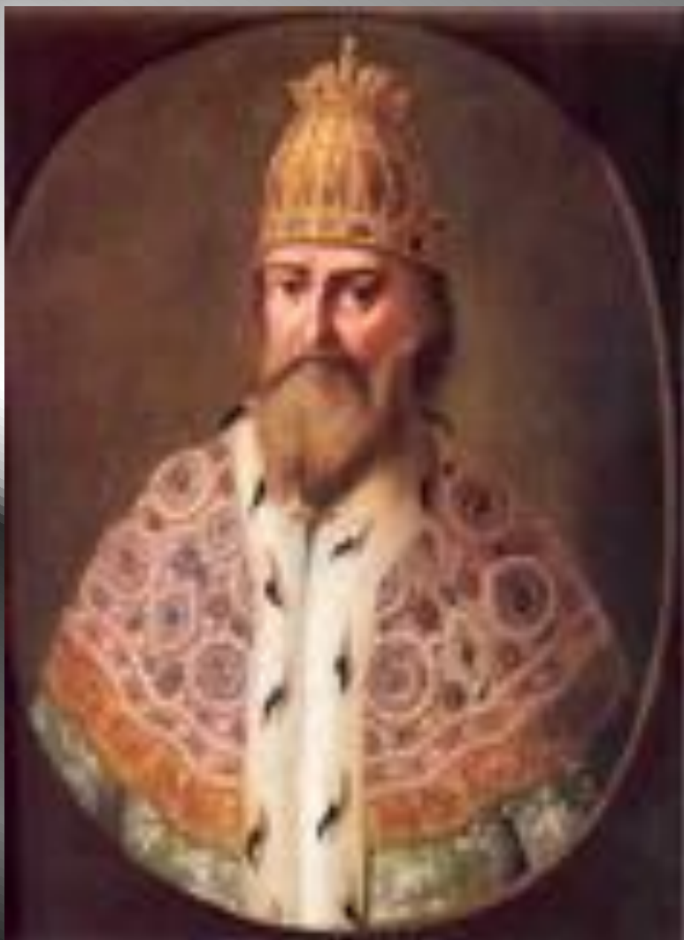
Иван IV Грозный