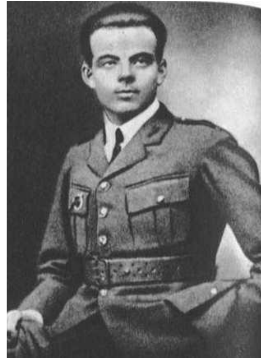
Антуан де Сент-Экзюпери