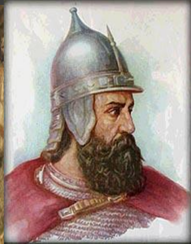
Дмитрий I Иванович Донской