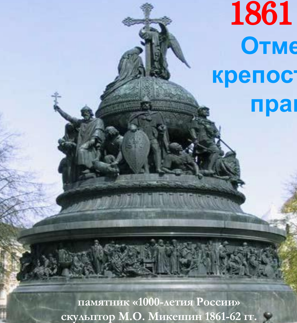
памятник «1000-летия России» скульптор М.О. Микешин 1861-62 гг.