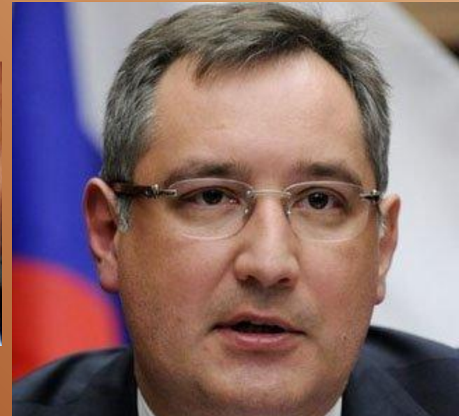
Д. Рогозин, представитель России в НАТО