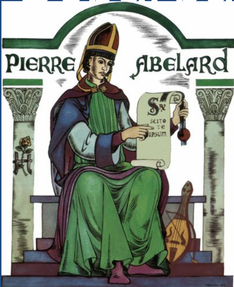
Пьер Абельяр французский философ, богослов и поэт

Сомнение признается философом началом всякого знания. Абельяр стремится понять то, во что верит. Он был самым известным из всех преподавателей парижских школ.