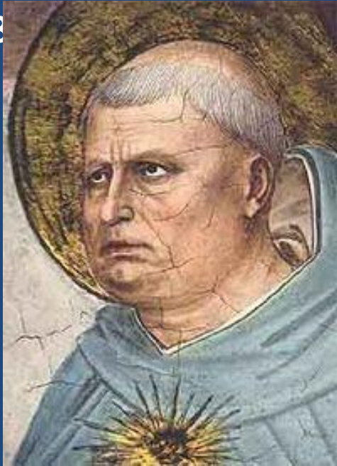
Вершина схоластики - творчество Ф. Аквинского