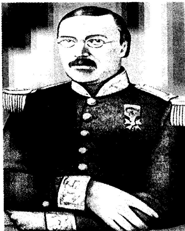
Жан Виктор Понселе — французский математик и механик.

Среди 238 пленных офицеров разных национальностей самым известным стал скромный сапер, а в будущем генерал, член Парижской и Петербургской академий Жан Виктор Понселе. В саратовском плену Понселе подготовил черновик труда, положившего начало проективной геометрии.