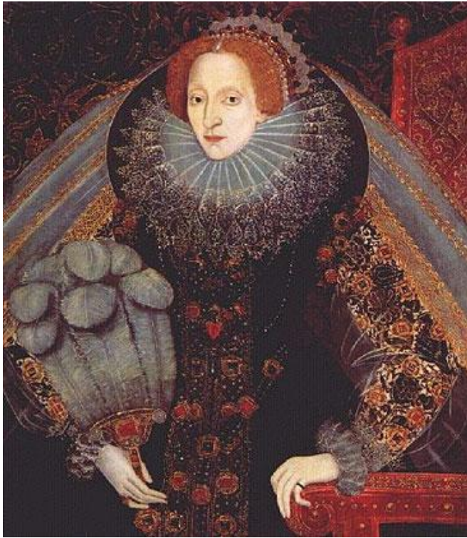
Портрет Елизаветы с веером 1585-1590-е гг.