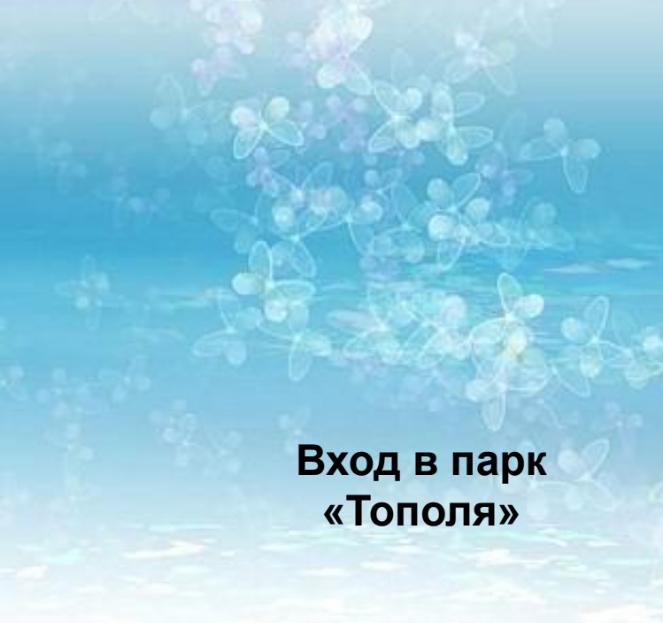
Вход в парк «Тополя»