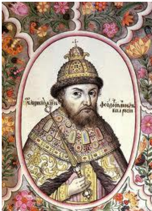
Федор Иванович (1584-1589 г.г.)