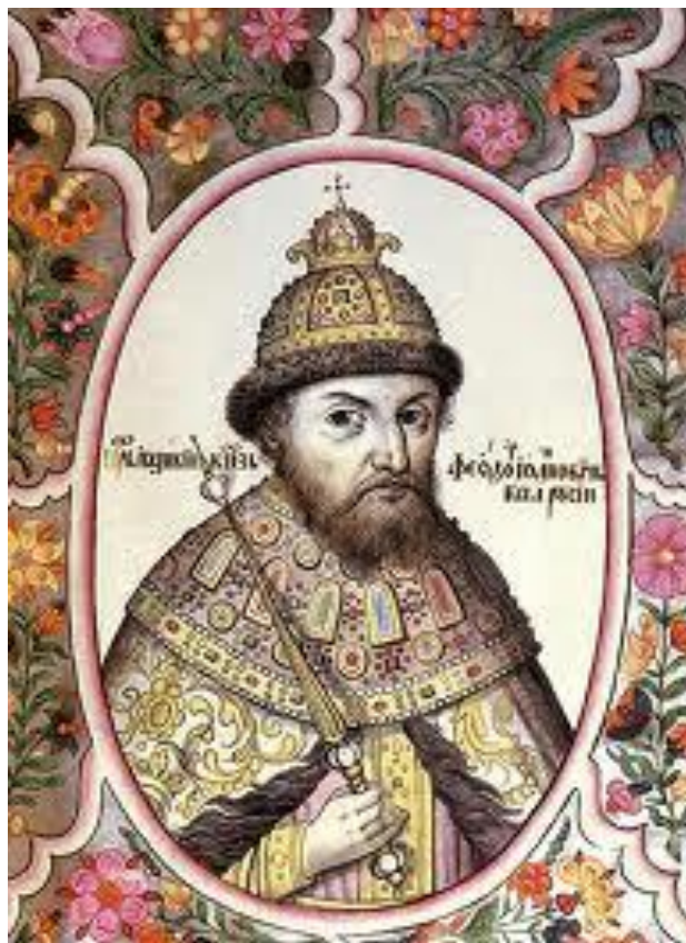
Федор Иванович (1584-1589 г.г.)