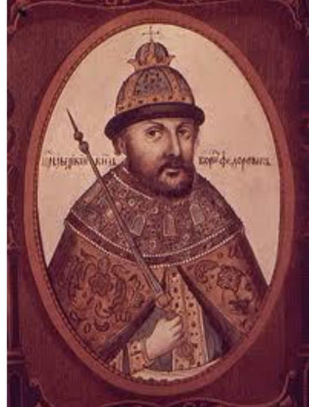
Борис Годунов (1589-1605г.г.)