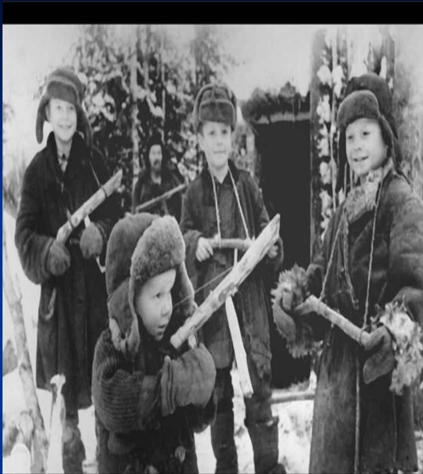
Репортаж из дня вчерашнего

22.01. У цю ніч 3-й сб 1235 сп переправився через р. Тясмин і заволодів південно-західною частиною с. Березняки. Відбивши кілька контратак ворога, закріпився на досягнутому рубежі. Ввечері ворог силою близько 200 осіб при підтримці сильного артилерійського вогню, 3-х танків, 2-х самохідок і 3-х бронемашин контратакував наші роти. В результаті важкого бою підбито два танки, самохідку і знищено десятки ворожих солдатів і офіцерів.