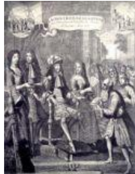
Прием русского посольства у Луи XIV, 1681 год

• Дипломатические поминки были двух разновидностей - официальные, направленные от монарха к монарху, и частные - от самих послов. Иностранные дипломаты в России и русские за границей постоянно подносили дары не только от своих государей, но и от себя лично. По большей части эти дары перед отъездом русских послов за рубеж выдавались им из казны. В казну они должны были вернуть и ответное «жалованье» иностранного монарха: наиболее ценные вещи царь оставлял у себя, остальное отдавалось послам.