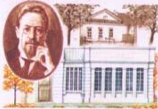
Центральная городская публичная библиотека имени А.П. Чехова