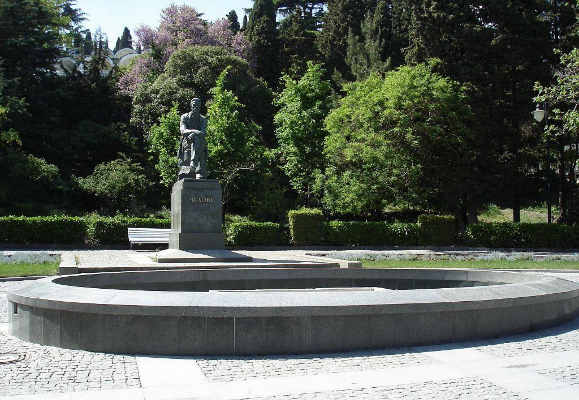
Памятник в Приморском парке Ялты