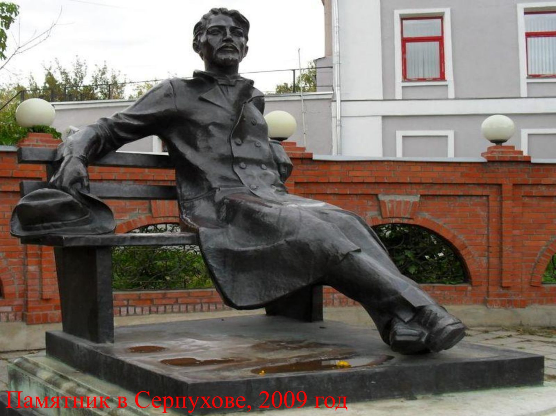
Памятник в Серпухове, 2009 год