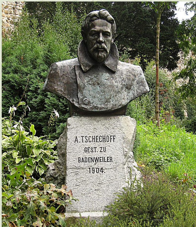
Памятник в Баденвайлере