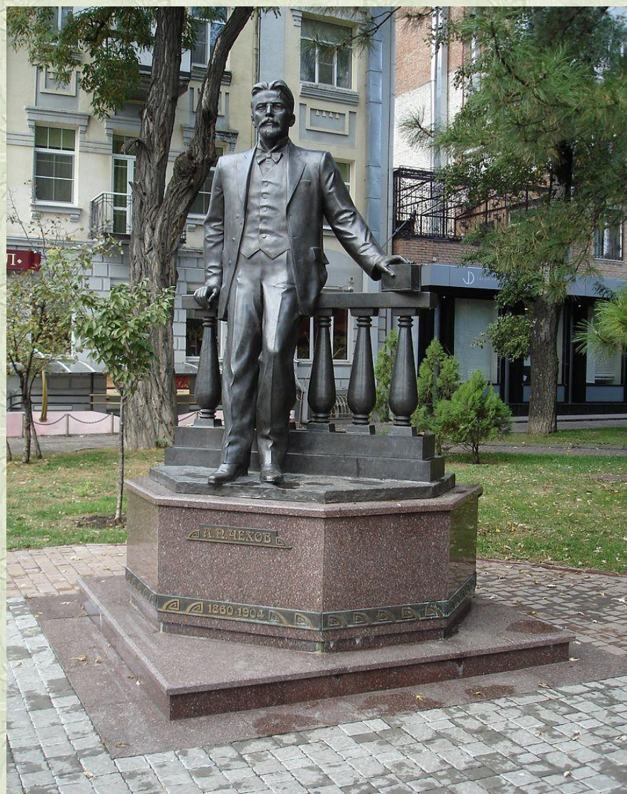
Памятник в Ростове-на-Дону