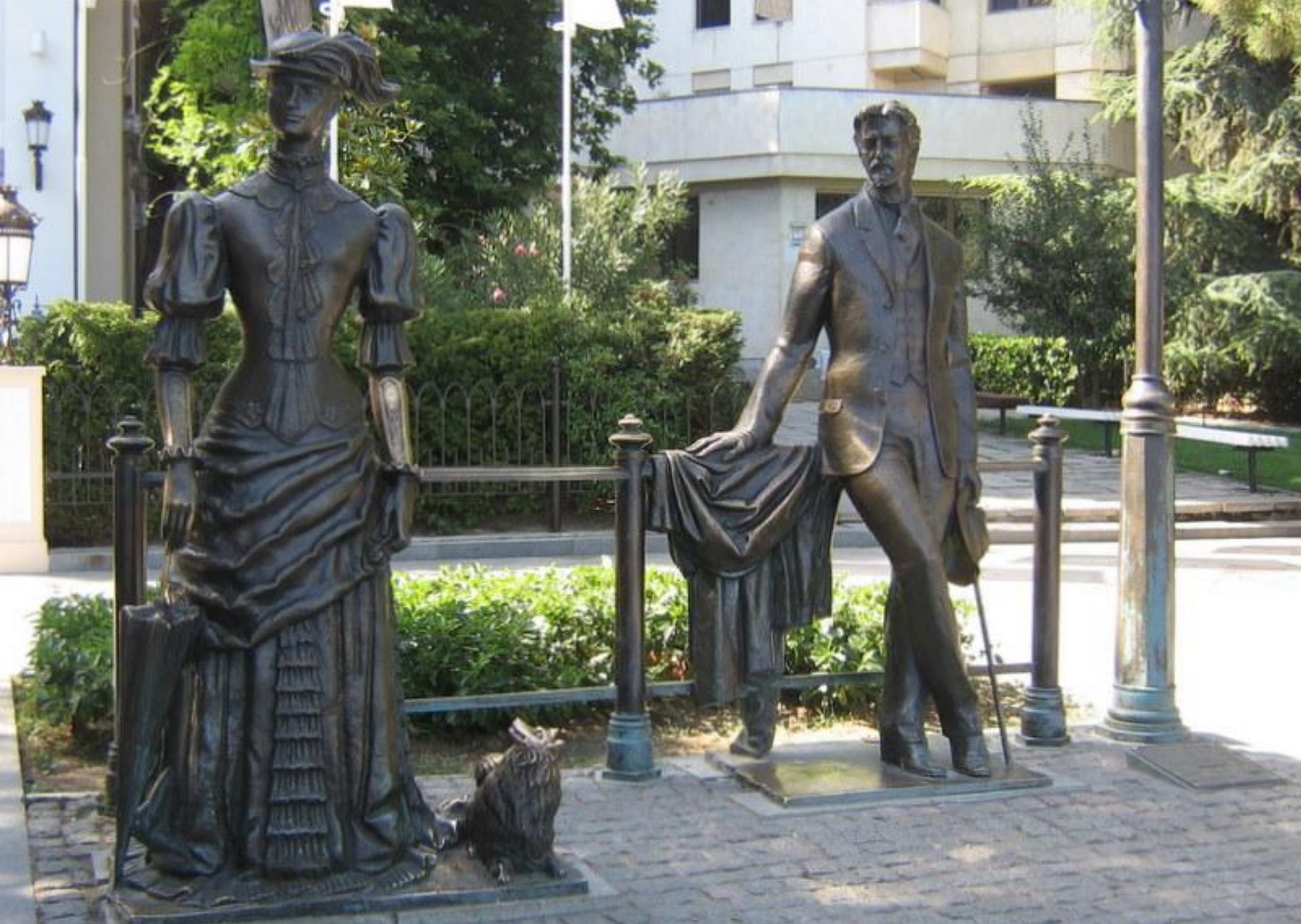
Чехов и его «Дама с собачкой» на ялтинской набережной