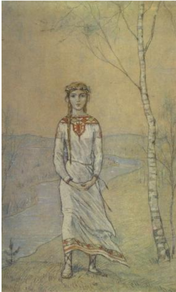
Илья Глазунов «Снегурочка»