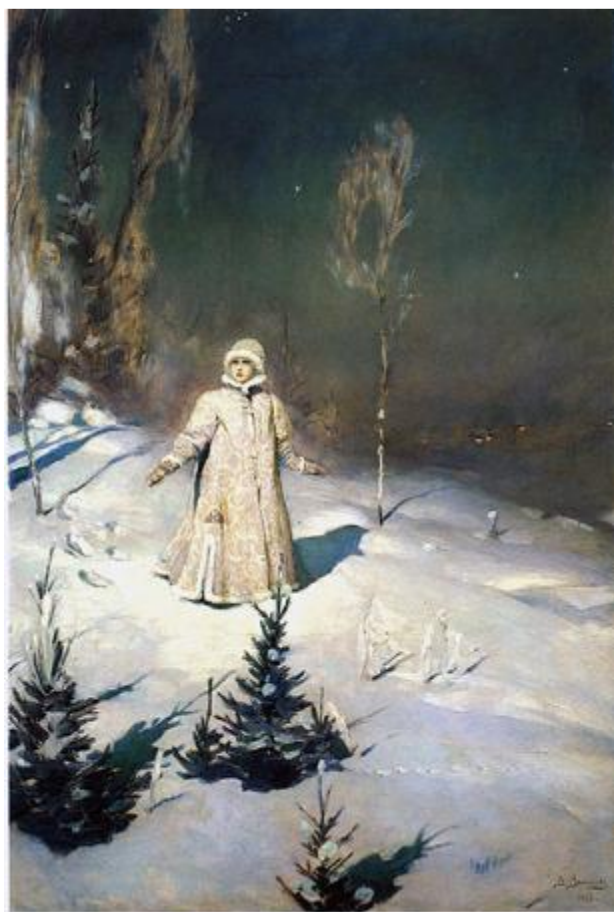
Васнецов Виктор Михайлович «Снегурочка»