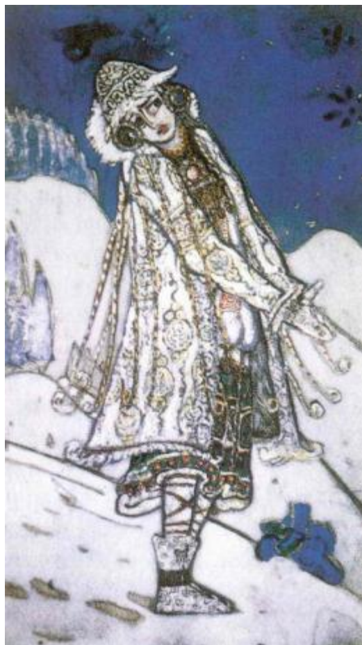
Рерих Николай Константинович «Снегурочка» Эскиз костюма