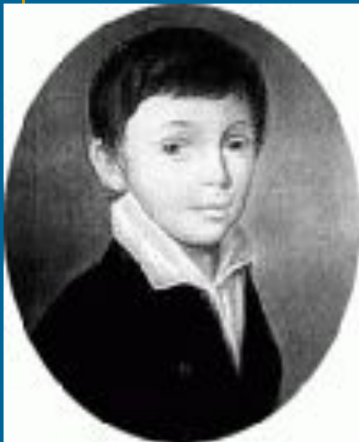
Портрет Е.А. Боратынского в детстве. Пастель Барду.