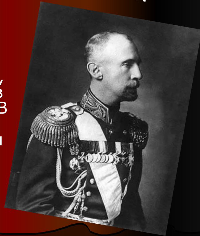
Великий Князь Дмитрий Константинович

Антио́х Дми́триевич Кантеми́р — знаменитый русский поэт-сатирик и выдающийся дипломат своего времени, деятель раннего русского Просвещения. Наиболее крупный русский поэт силлабической эпохи. Младший сын молдавского господаря, князя Дмитрия Константиновича, всецело посвятил себя мирной деятельности. Родился в Молдавии, Получил превосходное домашнее образование, дополненное кратковременным пребыванием в Греко-славянской академии и Академии Наук. В 18 лет Кантемир был избран в Российскую Академию Наук. 1 января 1732 Кантемир уехал за границу, чтобы занять пост русского резидента в Лондоне. состоял первоначально (до 1738) представителем России в Лондоне, а затем в Париже. Кантемир скончался 31 марта (11 апреля) 1744 в Париже и погребен в Московском Никольском греческом монастыре.