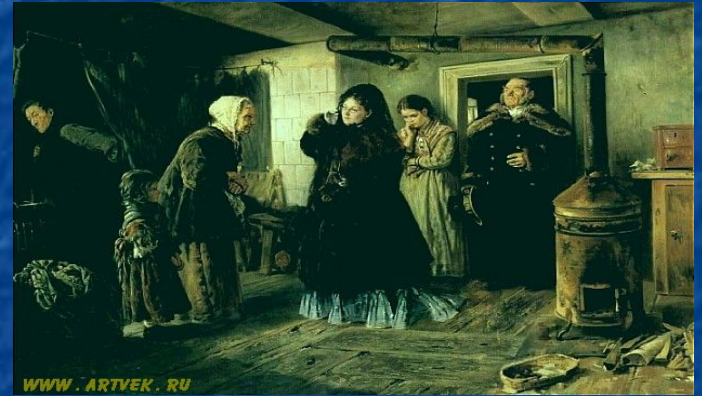
Социальный срез общества