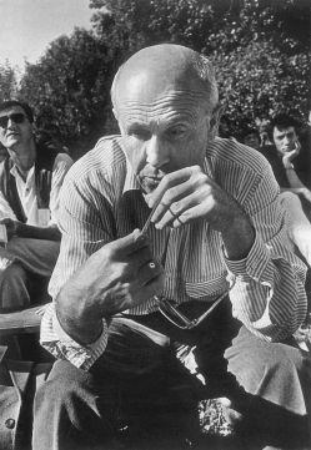
Борис Петрович ЕКИМОВ