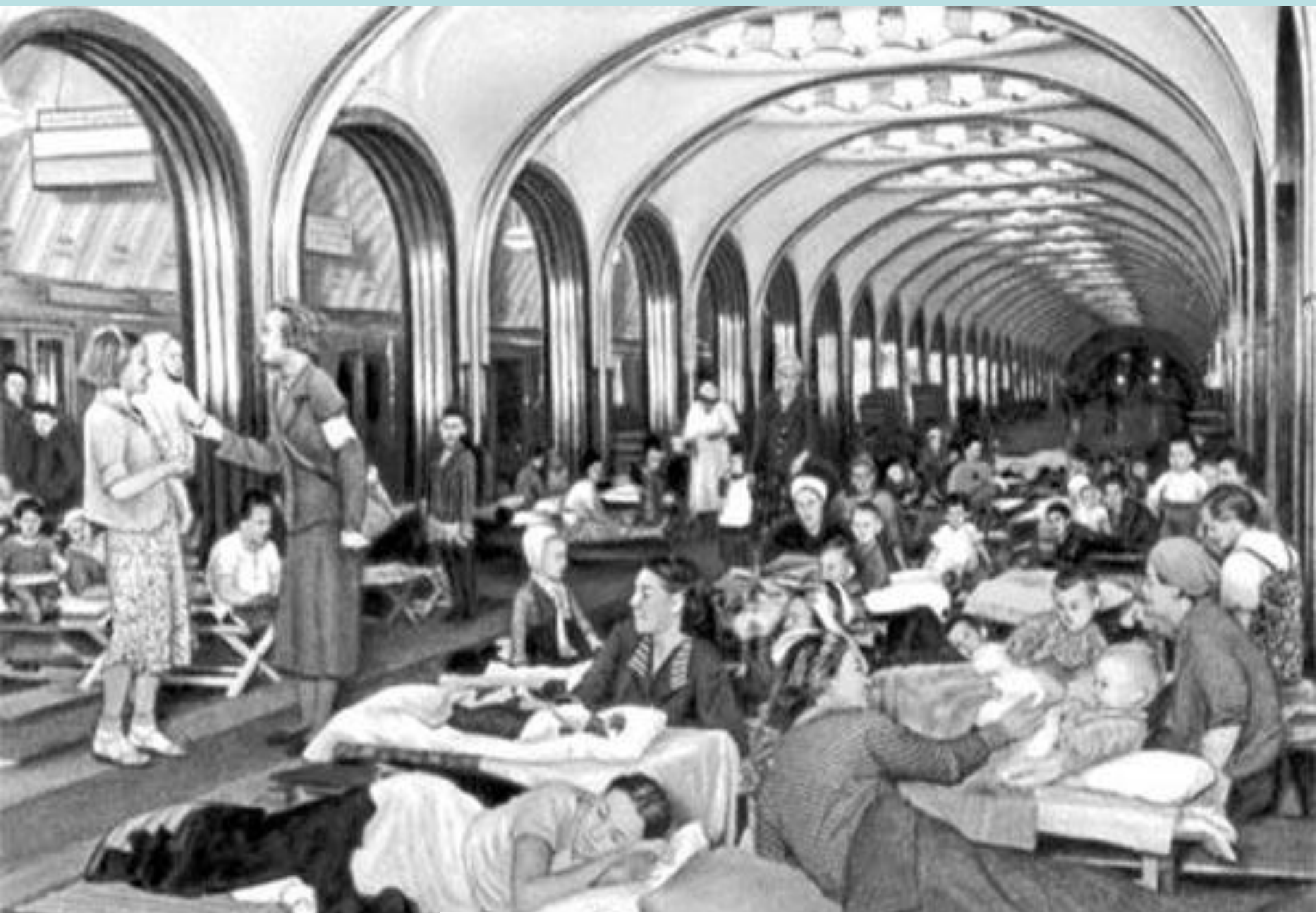
Во время авианалета в Москве