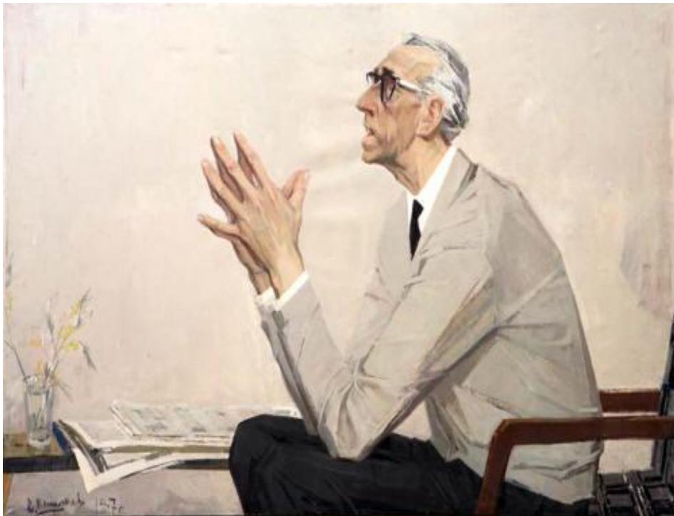
Портрет Д. Кабалевского 1971год