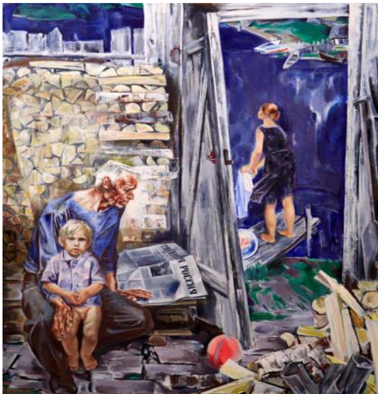
Посреди России 1983год