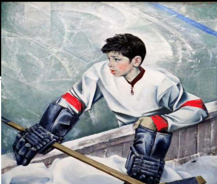
Юный хоккеист 1971год