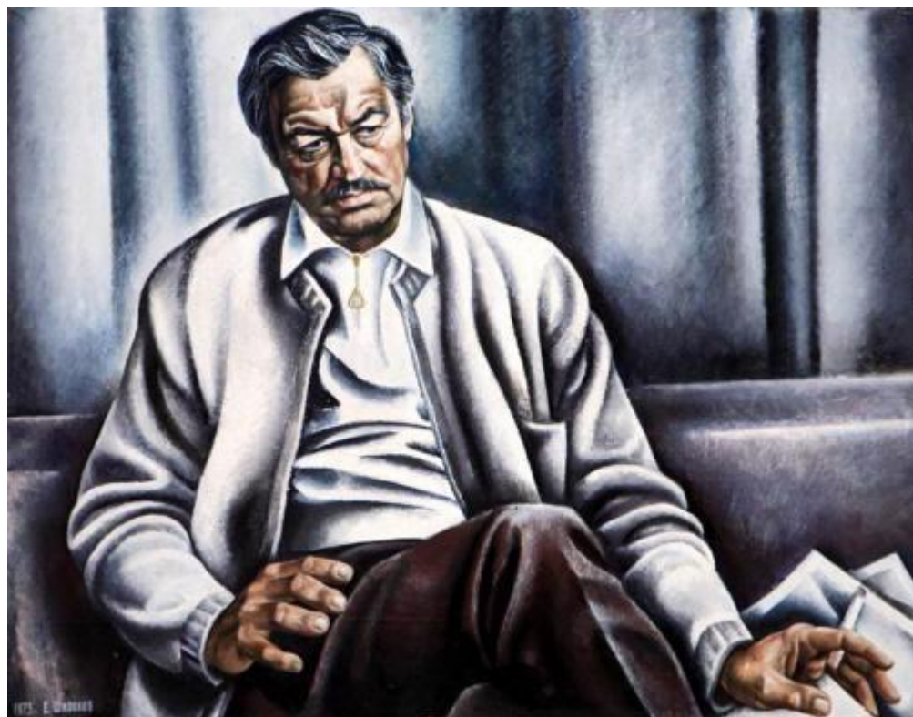
Портрет актера Е. Капеляна 1973 год