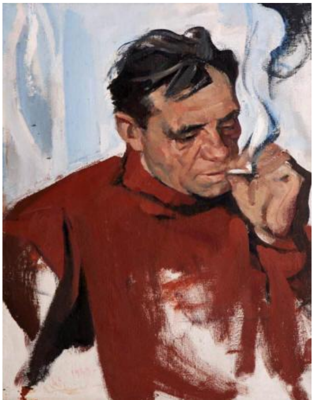
Портрет писателя В.П.Астафьева 1969год

Одной из наиболее востребованной тематической разновидностью портрета почти на десятилетие станет портрет-раздумье.