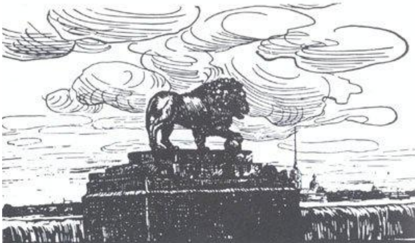
Иллюстрация к поэме «Медный всадник»