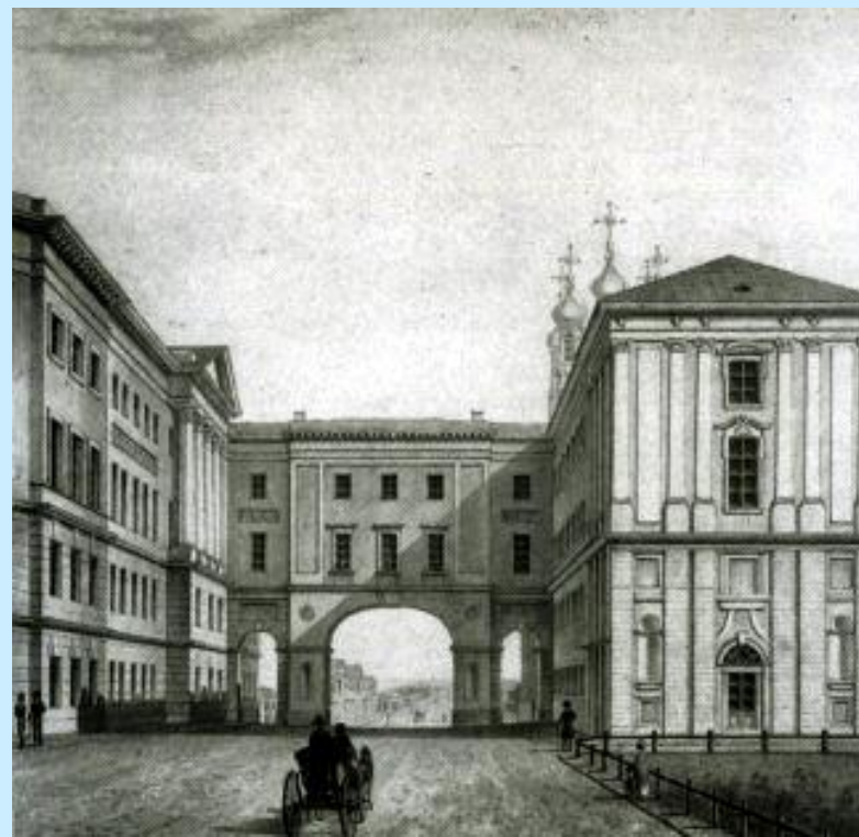
Рисунок XIX века