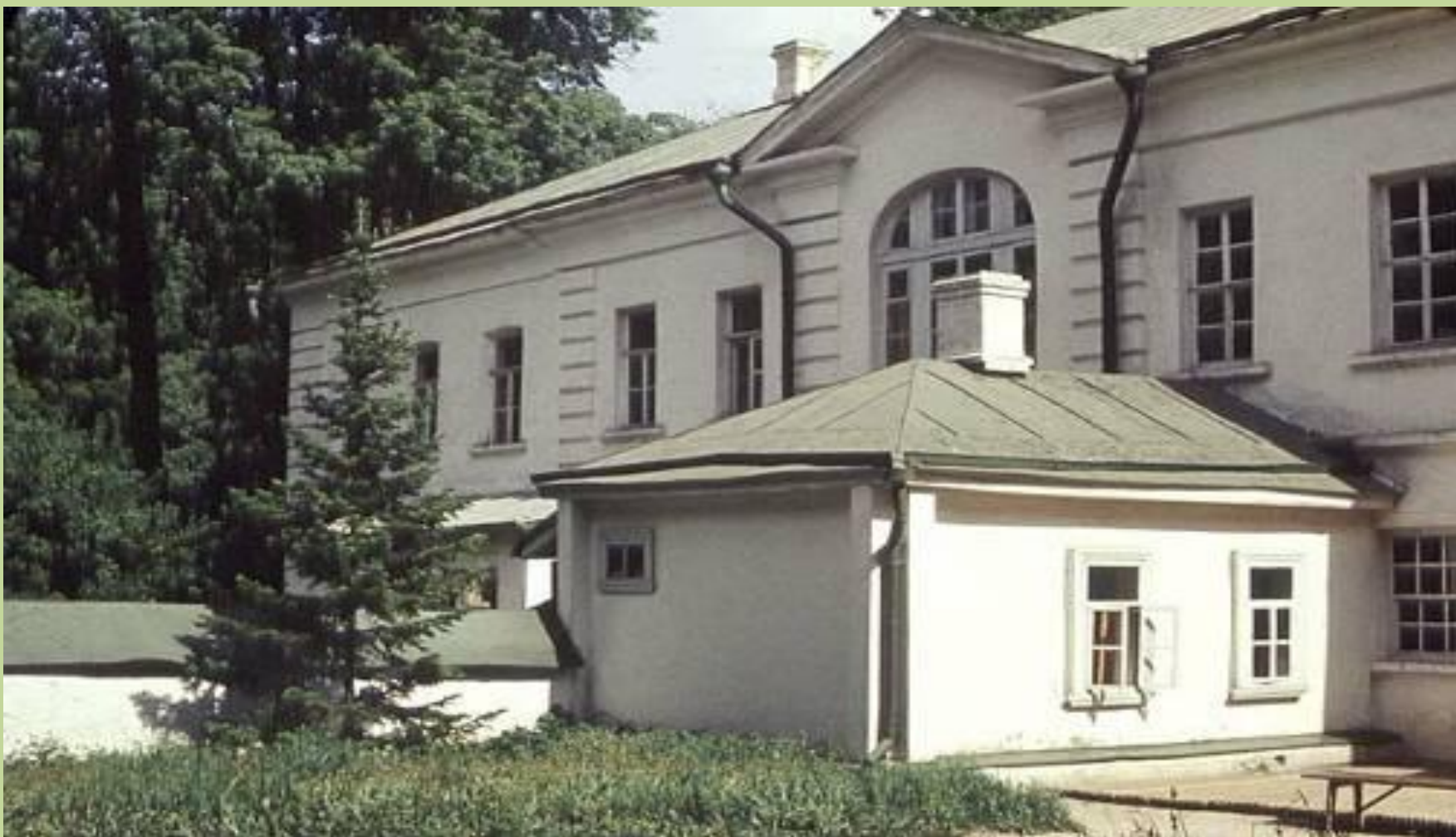
Ясная Поляна. Главное здание усадьбы Л. Н. Толстого.