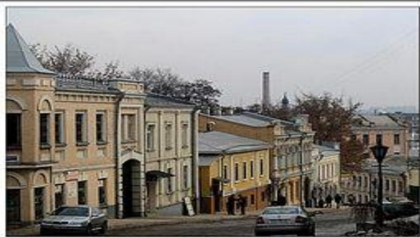
Киев, Андреевский спуск