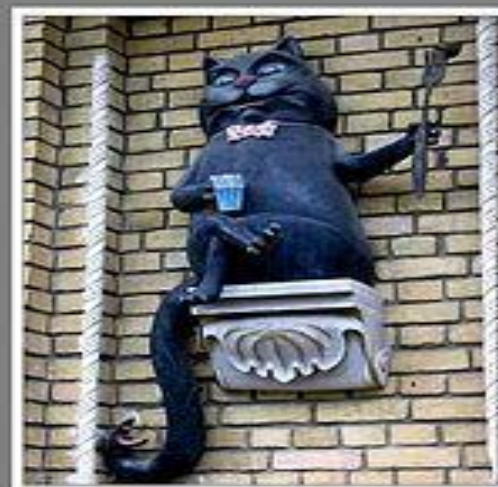
Кот Бегемот (до недавнего времени был достопримечательностью Киева и Андреевского спуска)