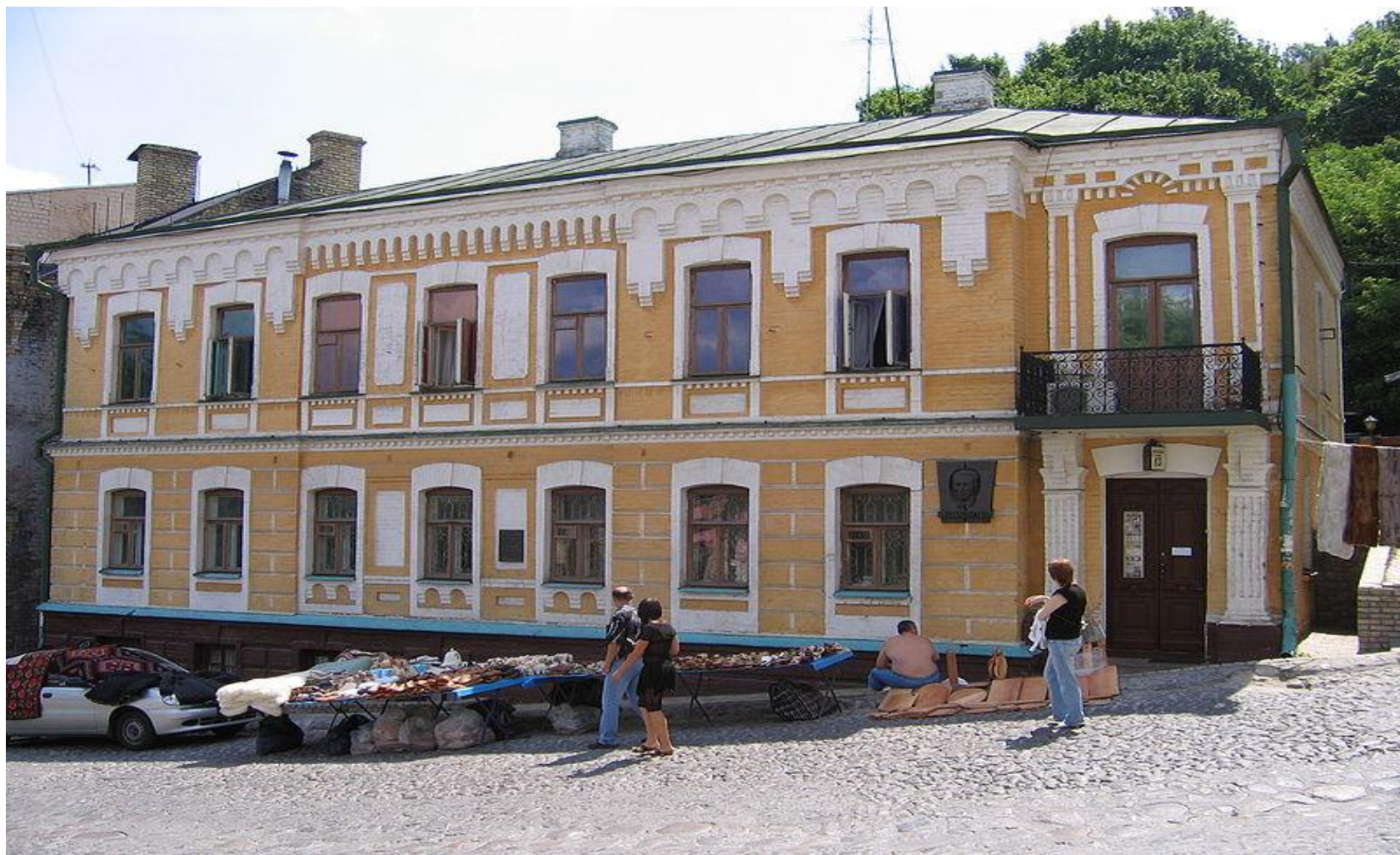
Дом Булгакова в Киеве