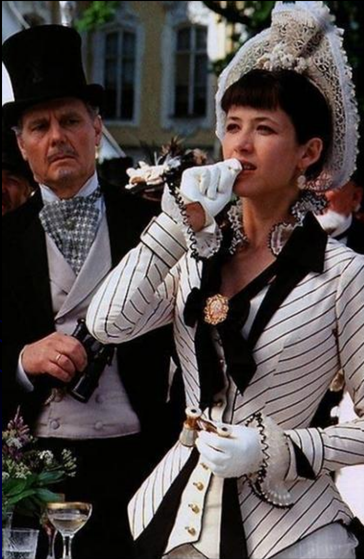
Софи Марсо в роли Анны Карениной